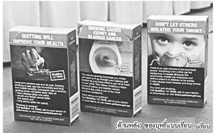
(ด้านหลัง) ซองบุหรี่แบบเรียบ มเรียบ

จากกรณีองค์การการค้าโลก (WTO) ได้มีคำตัดสินคดีพิพาทกรณีของ บุหรี่แบบเรียบ (Plain packaging) ที่ บริษัทบุหรี่ข้ามชาติใน 4 ประเทศ คือ ฮอนดูรัส สาธารณรัฐโดมินิกัน คิวบา และอินโดนีเซีย ฟ้องร้องต่อองค์การการค้าโลก ซึ่งผลการตัดสินเป็นทางการเมื่อวันที่ 28 มิถุนายน 2561 ว่า มาตรการซองบุหรี่แบบเรียบของออสเตรเลียไม่ขัดต่อกฎระเบียบขององค์การการค้าโลก